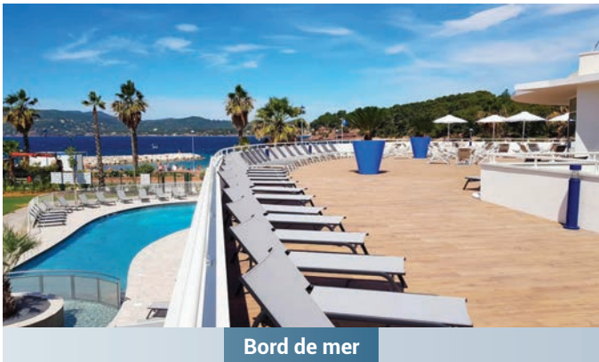
Bord de mer

Depuis sa création, CONSULTIM GROUPE * a commercialisé, par l'intermédiaire de son réseau de professionnels du patrimoine, 60 000 logements pour un volume de près de 9 milliards d'euros