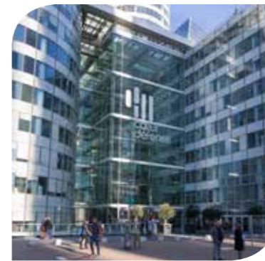
COEUR DÉFENSE (SCI HOLD) - COURBEVOIE (92)