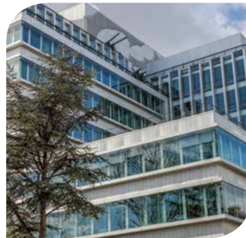
NEWTIME (SCI PREIM NEWTIME) NEUILLY-SUR-SEINE (75)