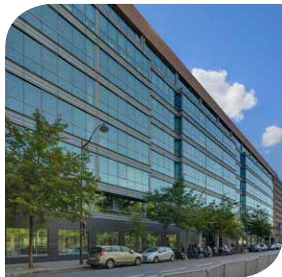
LE VALMY MONTREUIL (93)