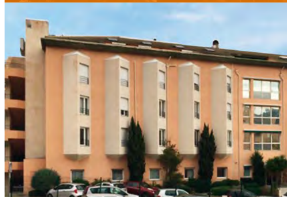
EHPAD Alzheimer - Bastia*

*Investissements déjà réalisés qui ne préjugent pas des investissements futurs.