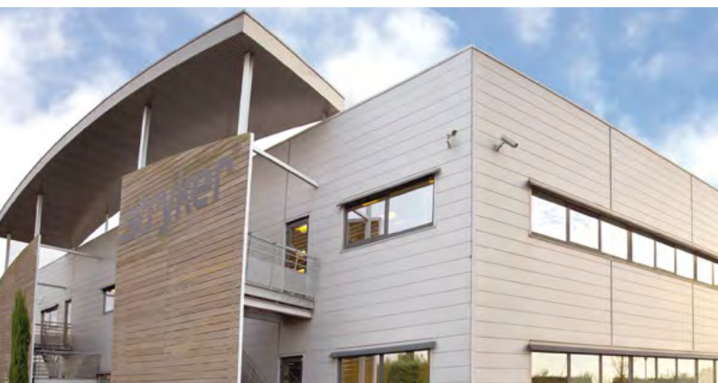
SIÈGE SOCIAL STRYKER - Pusignan (Lyon)*