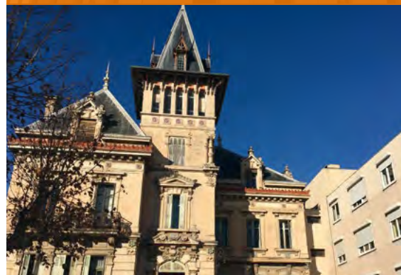
CLINIQUE MCO - Salon de Provence*