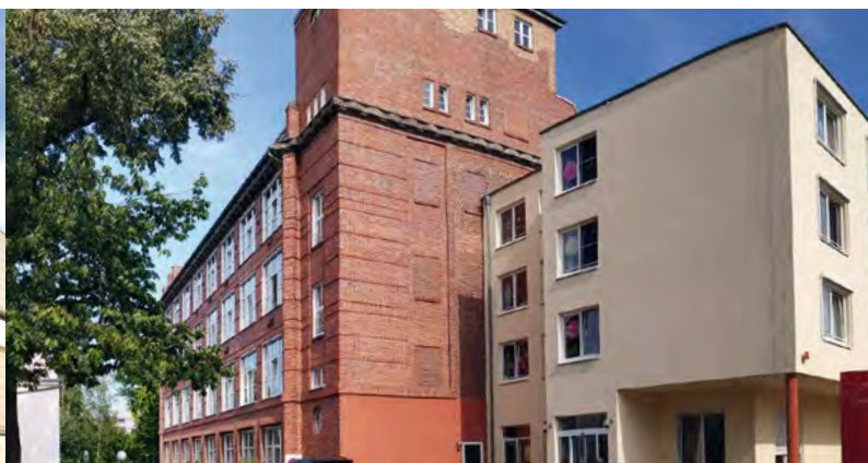
EHPAD Alzheimer - Guben (Allemagne)*