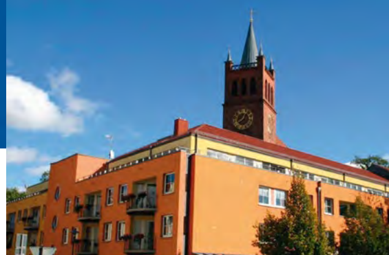
EHPAD Alzheimer - Müncheberg (Allemagne)*