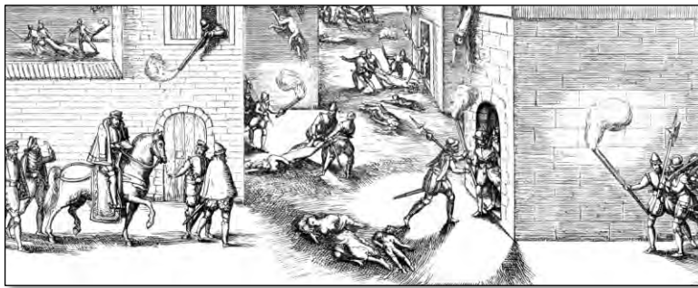
1572 : le massacre de la Saint-Barthélemy