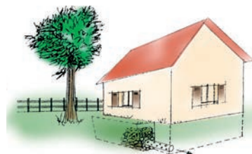
La tranchée drainante